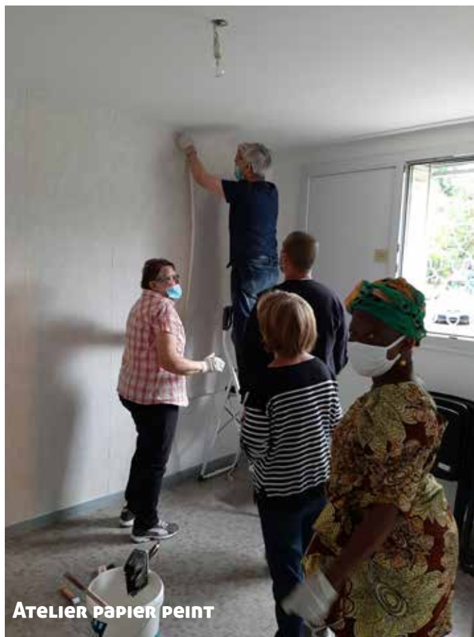
ATELIER PAPIER PEINT

➤ des expériences de mixité inter quartier positives.