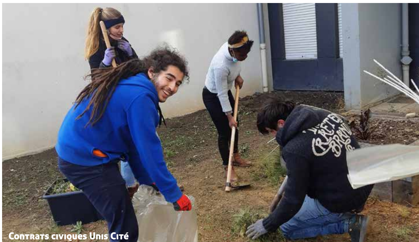
CONTRATS CIVIQUES Unis Cité