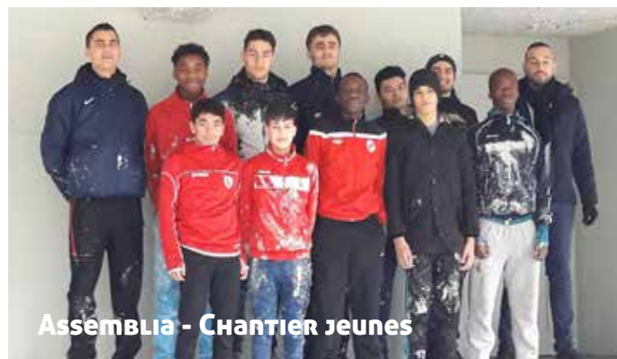
Assemblia - Chantier jeunes

aussi d'entrer en contact avec les habitants des immeubles, et au final de permettre à leur association de toucher une subvention et de mettre en place une activité dont ils n'auraient peut-être pas bénéficié. Chaque année notamment, Assemblia organise pour des jeunes du club de foot de Saint-Jacques des chantiers de mise en peinture. L'année précédant la crise sanitaire, cette action leur a permis de participer à un tournoi de foot professionnel en Espagne.