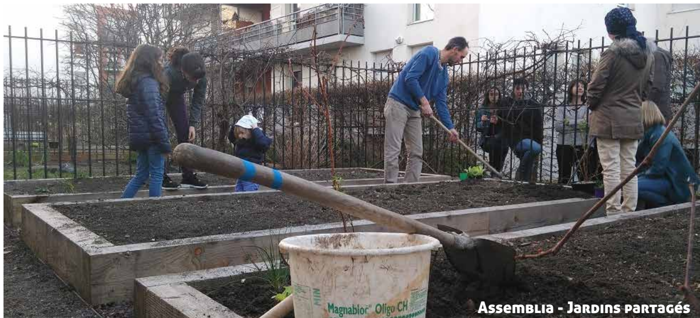
ASSEMBLIA - JARDINS PARTAGÉS

L'AFEV Auvergne est une association dont l'objet est la mise en place d'actions de solidarité, notamment dans les domaines de l'accompagnement à la scolarité, de l'animation sportive et culturelle. Le projet de « Colocations solidaires » vise à contribuer, par l'engagement citoyen d'étudiants, à une dynamique territoriale au sein des quartiers populaires. Assemblia est