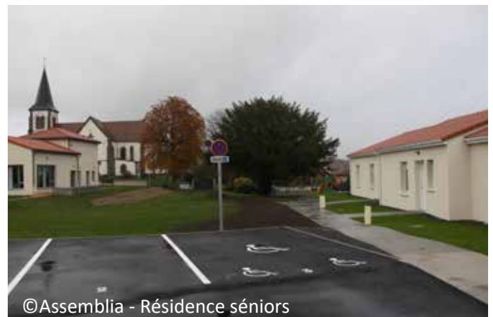
Résidence séniors

Conseil départemental du Puy-de-Dôme, auprès de 3 000 personnes âgées, habitant le bassin de vie. 700 séniors ont répondu et se sont majoritairement déclarés favorables à l'implantation de logements adaptés. Ils ont parallèlement eu la possibilité de s'exprimer sur leurs attentes en termes d'habitat, telles que la taille de leur logement, les services attendus, le montant du loyer, etc.